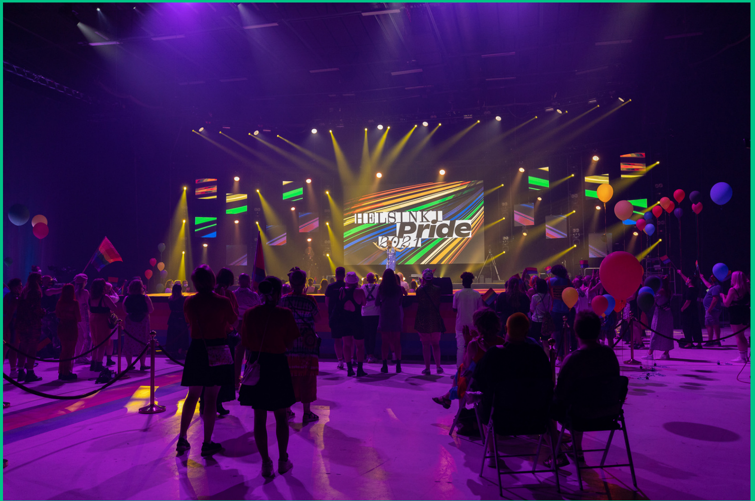
HELSINKI PRIDE 2021 KONSERTTI