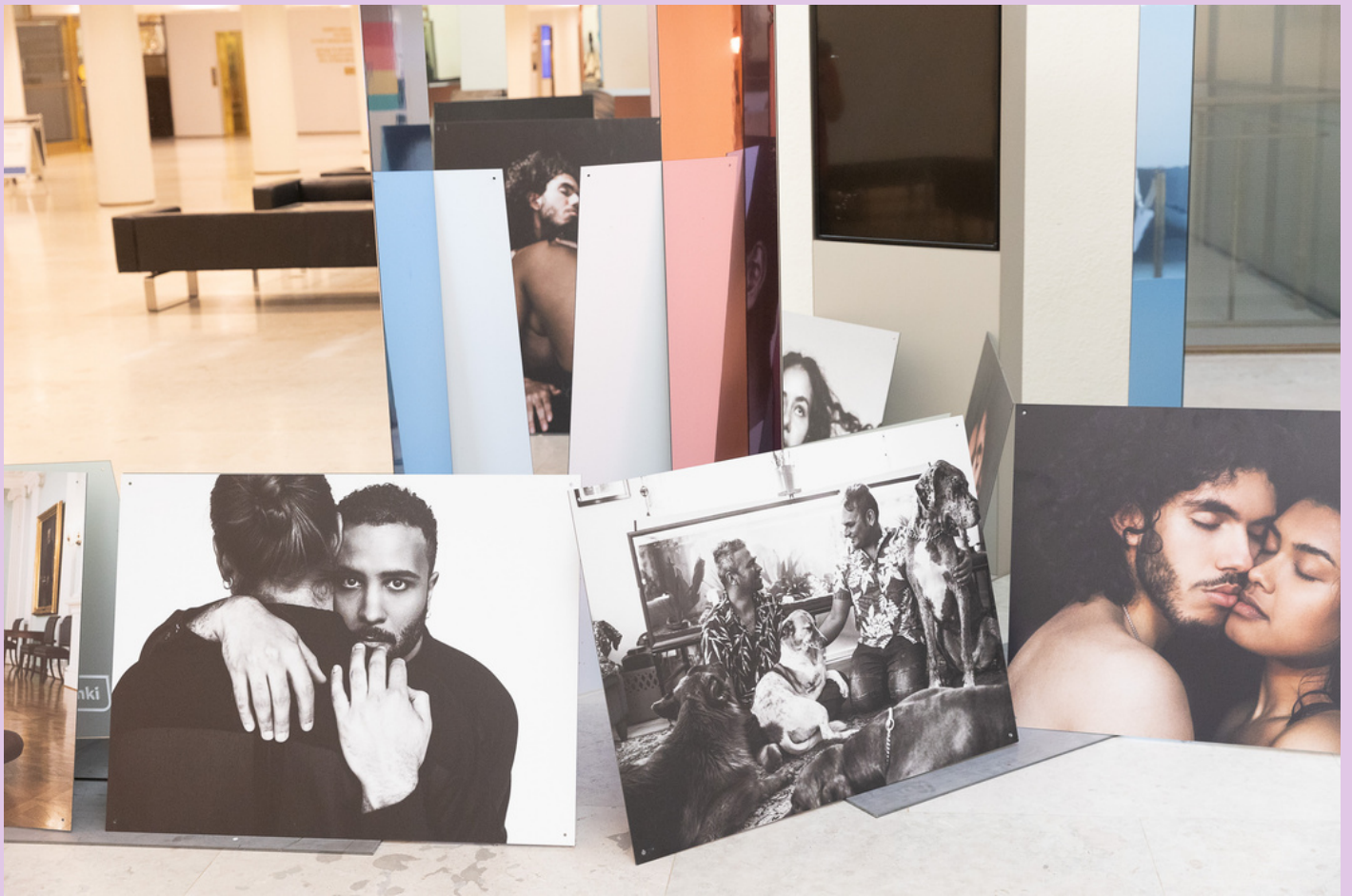
MEISTÄ-ABOUT US-NÄYTTELY PRIDE HOUSESSA