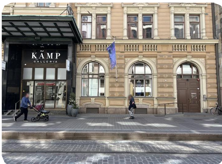
1. Hobo Hotelin aistiystävällinen sisäankäynti

Jos tila on täynnä tai ylikuormitit kaukana siitä, voit turvallisesti pyytää Priden henki- lökunnalta apua tilaan pääsemiseen. Tarvittaessa voit kommunikoida heille kommu- nikointikorteilla.