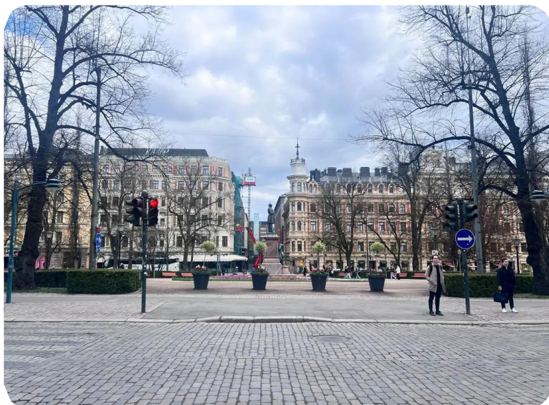
6. Rauhallisemman blokin liittymiskohta Esplanadin puistossa

Osallistujien toivotaan saapuvan Esplanadille noin klo 13.