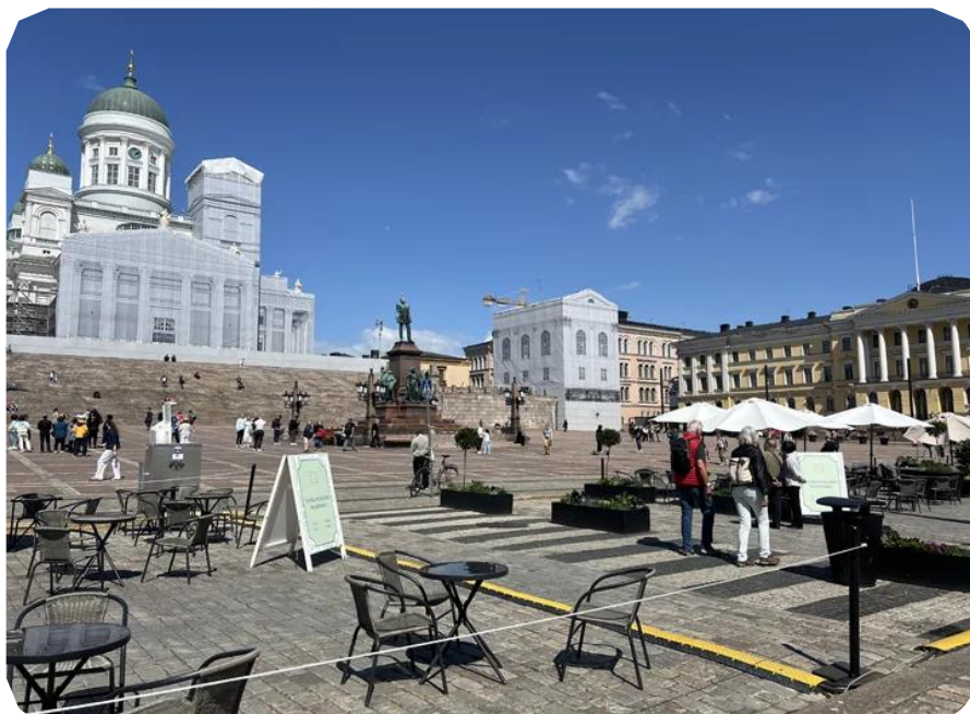
5. Pääkulkueen kokoontumis- ja järjestäytymispaikkana toimii Senaatintori

Kulkueen kärjessä lähtee Helsinki Priden esteetön rekka, Dykes on Bikes moottoripyörät ja sateenkaariratikka. Kävelijät, joille on osoitettu blokki, järjestäytyvät kävelyblokkeihin kumppanirekkojen väleihin. Selvästi suurin blokki on ns. avoin blokki, joka on nimensä mukaisesti kaikille avoin. Se lähtee viimeisen 10. rekan perässä. Kulkueen tuottama aistikuormittavuus vaihtelee eri osissa (esim. Musiikkia soittavat rekat), mutta on rauhallisempaa blokkaa lukuun ottamatta erittäin korkea. Rauhallisemmassa blokkissakin se on korkea. Kulkue myös kerää paljon yleisöä, mikä tuo oman lisänsä tapahtuman kuormittavuuteen.