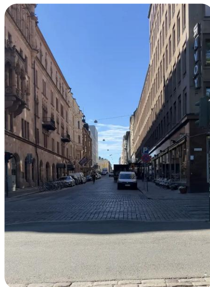
7. Kasarminkatu Esplanadilta päin.