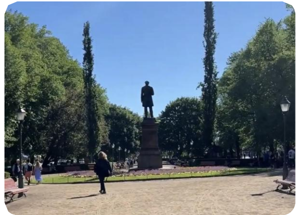
4. Maamerkinä toimii Eino Leinin patsas

Rauhallisemman blokin liittymiskohta on merkitty seuraavan sivun karttaan Pohjoisesplanadin ja Kasarminkadun kulmaukseen.