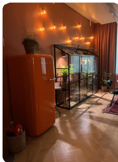
2. Rauhallinen tila Greenhouse